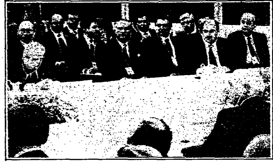
اطراف التسوية .. تنتظرهم جولة مفاوضات متعددة الاطراف في روما