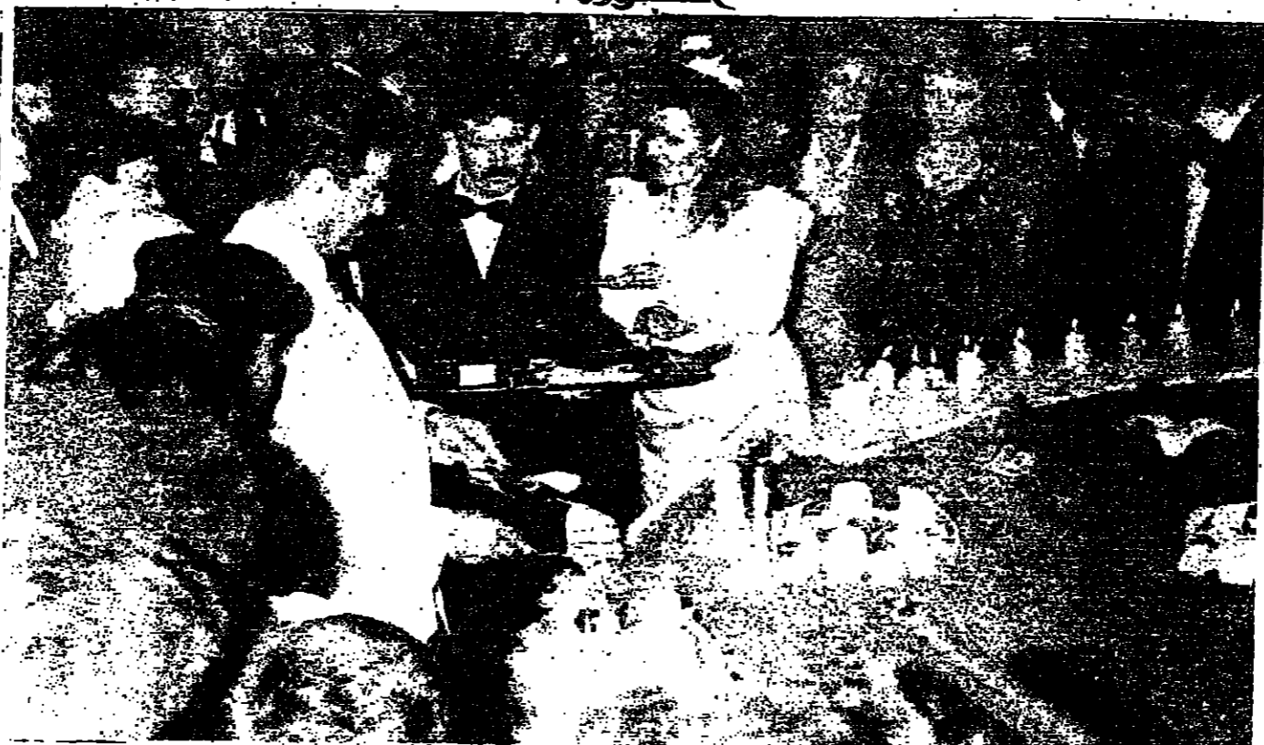
للقات الحبيب يقطع كعكة الميلاد ابناها بالتحفاية العراقيين