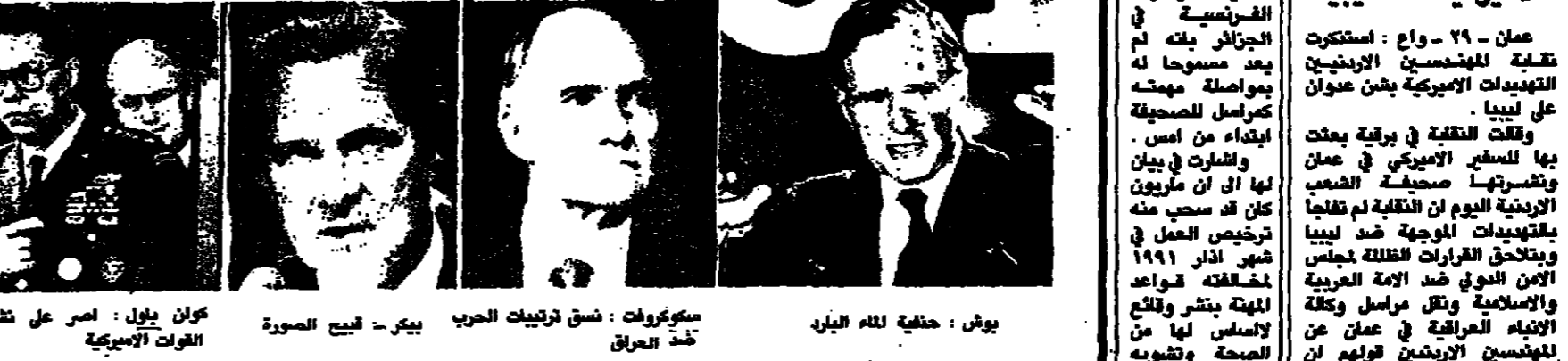
بوش: حليفه للاميرال سكوت كروفت: شق ترتيبات الحرب بيكر - فيليب الصورة كون يول: امر على نشر كيني: جنرال بلا تجربة جون ستونو: المتطرف المحرور