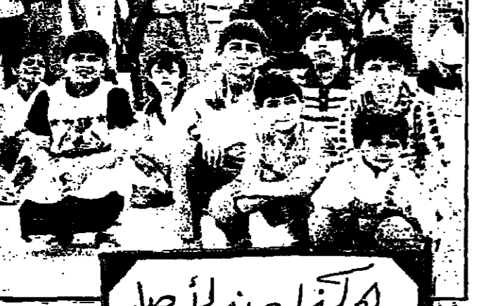
هكذا عند الاصل

تعبقيا على ما نشرته «رياضة وشباب» تحت عنوان (حدث هذا في ملعب الكوت) اتحاد الكرة في واسط يفتي .. والصورة البغض ناهة !!