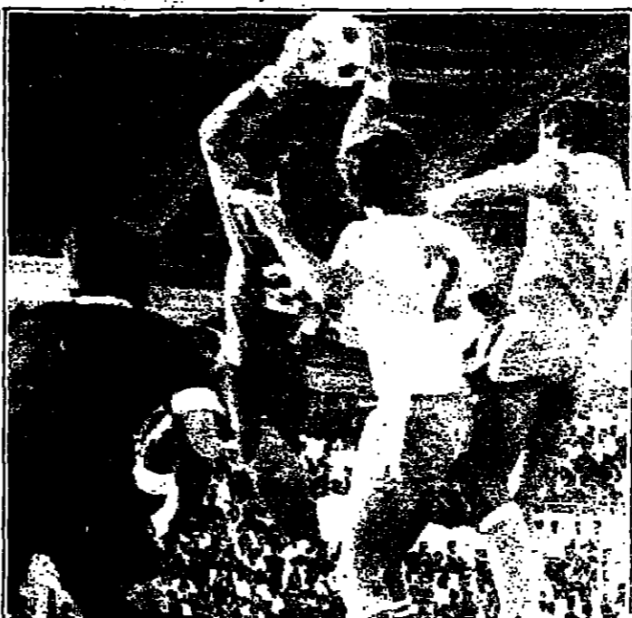
تقرير ان تمام مباريات الدوري عند الساعة الخامسة صمرا بدلا من الرابعة والنصف ابتداء من اليوم ..

الكل يبحث عن ضلته .. والاوز هدف مشروح من بنيت البحث عن الطريق الصحيح اليه .. ومباريات الاسبوع الثلاثون لدوري الكرة التي تبدأ اليوم هي التي مقررة بالصورة وضوحا ومستخلصا عن المراتب الاربعة التي من اطراف المسابقة ..