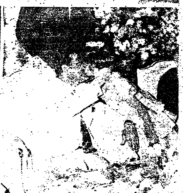
ليلة حب وولاء الى المستقبل