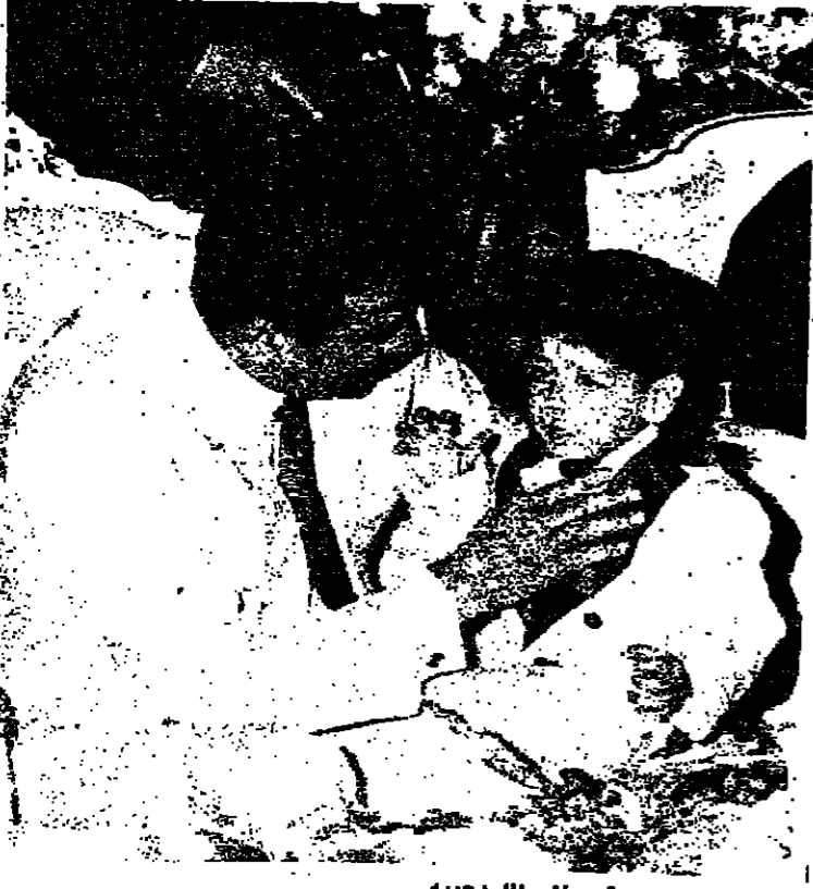
العمد الحبيب يستمع الى طفل بحبيبه